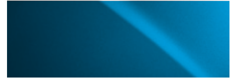
MANHATTEN GREY | 1H5