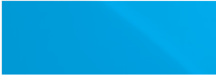
SONIC WHITE | 085